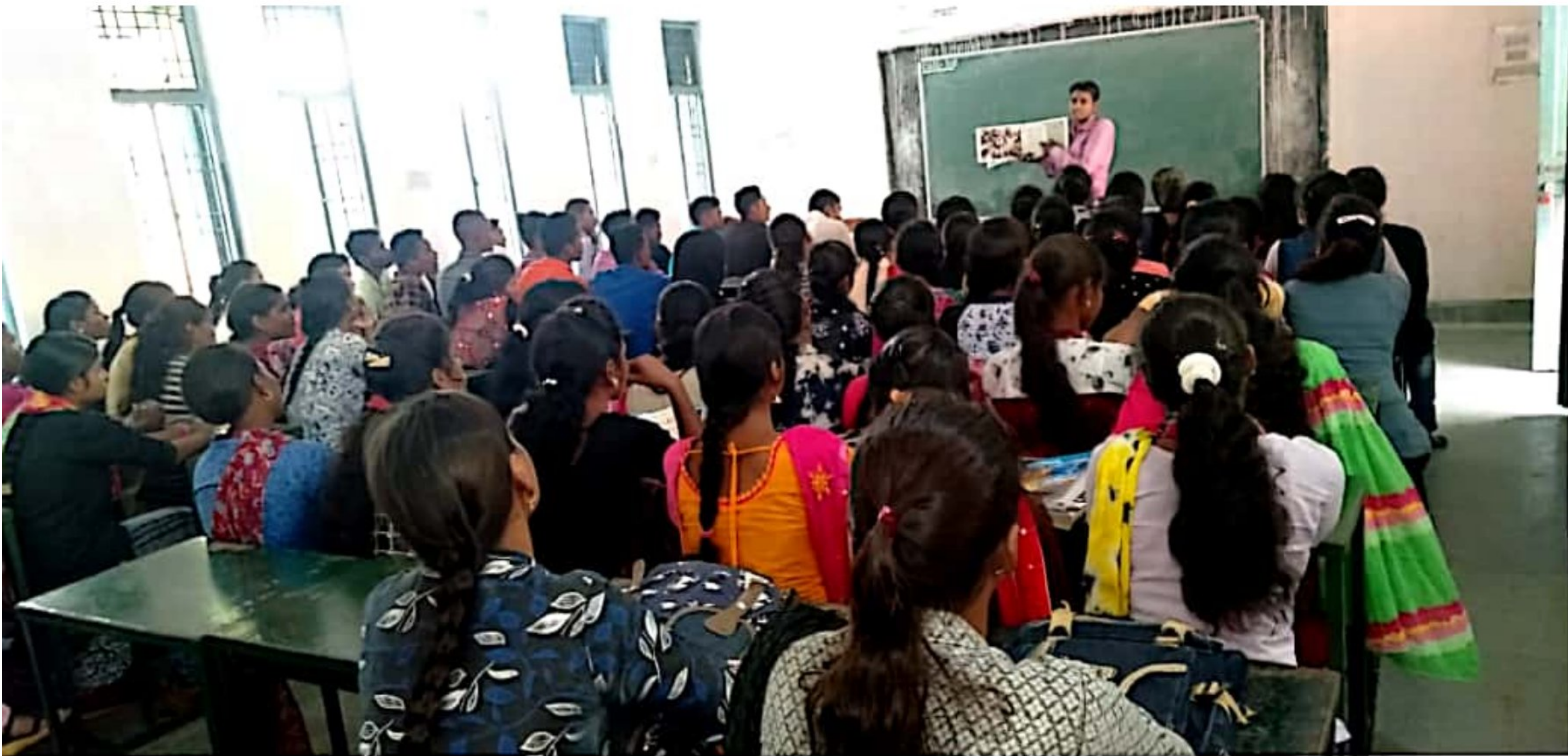
Carrier Guidance Seminar Under Rashtriya Uchatar Shikhya Abhiyan Date:- 23/02/2016