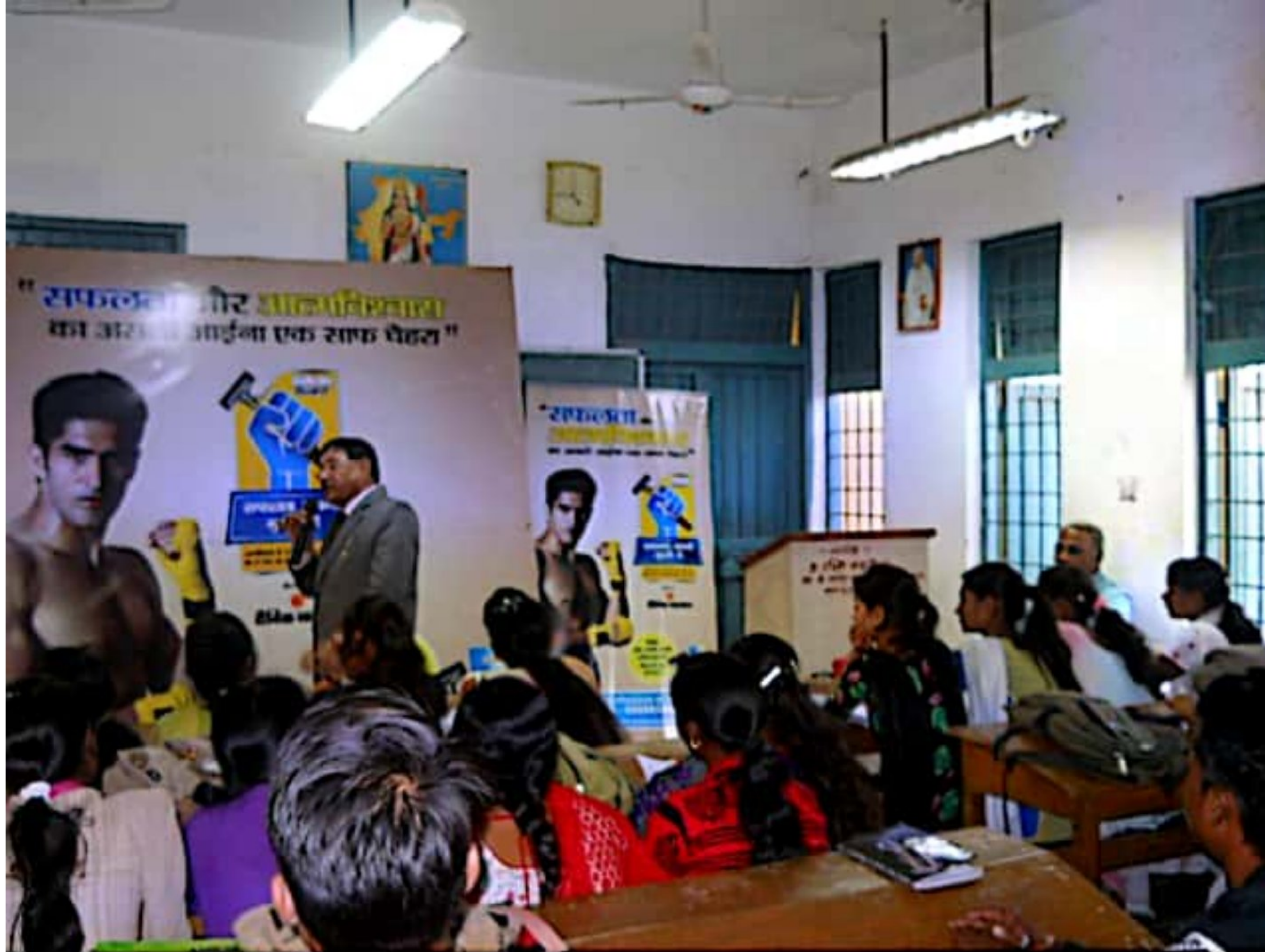
One Day Career Guidance Workshop Date :- 07/12/2016