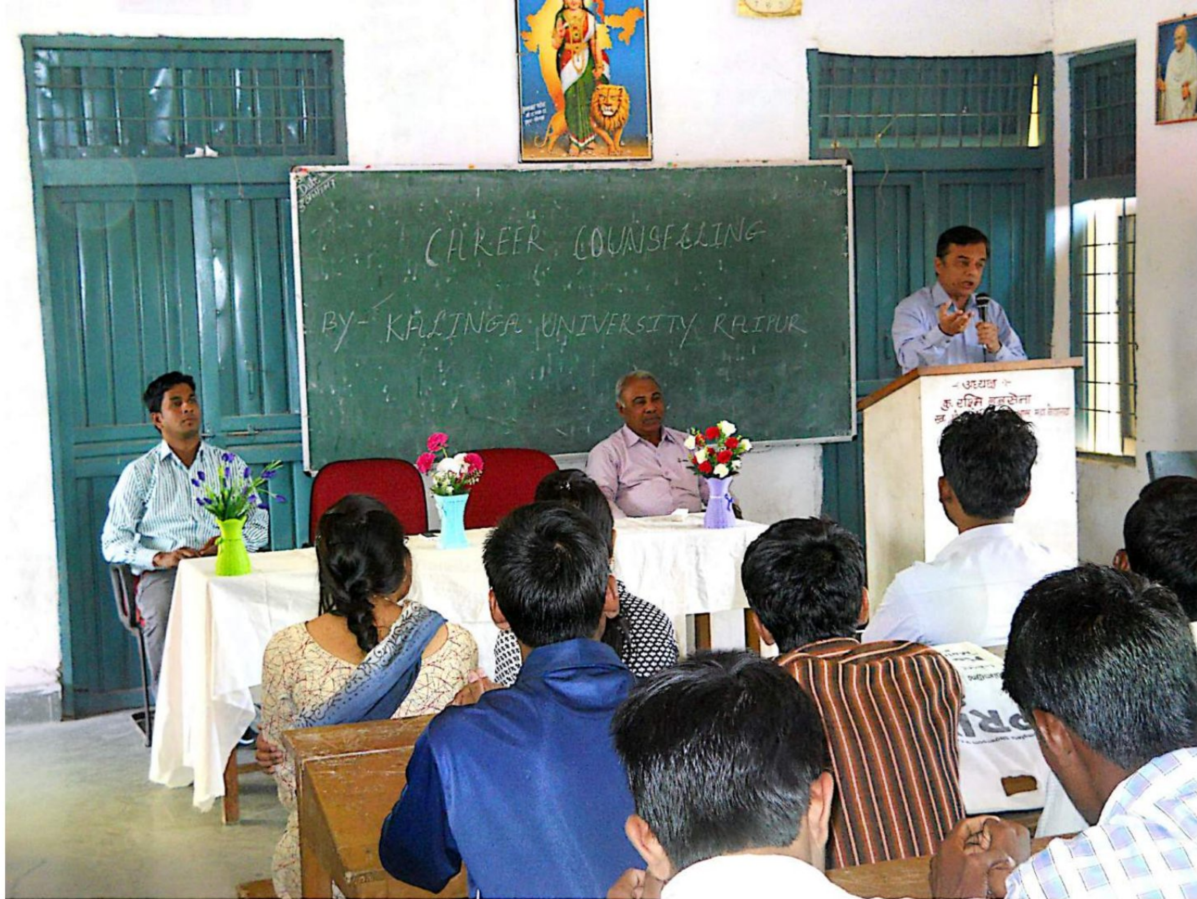
Career Guidance Workshop Under Rashtriya Uchatar Shikhya Abhiyan Date :- 30/01/2017